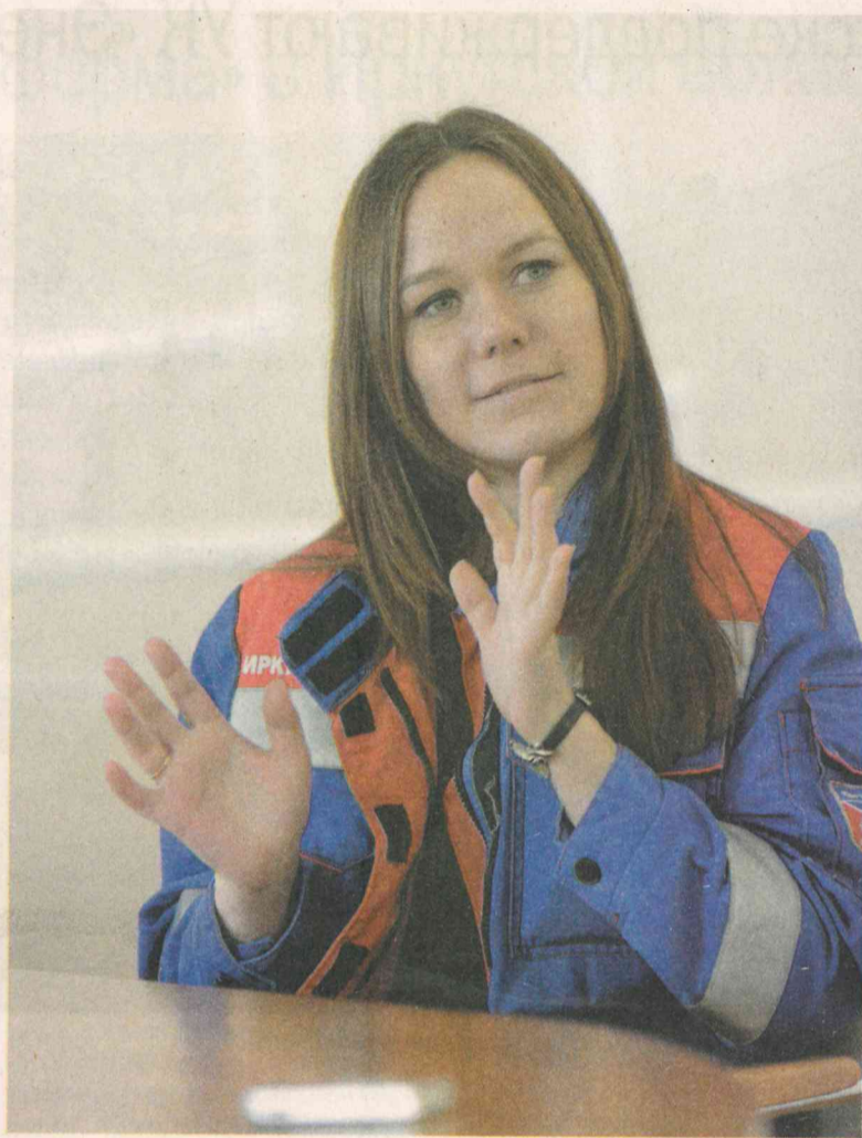
Работа в теплоэнергетике не только ответственная, но и интересная, говорит девушка

– Не совсем так. Кроме меня в группе собственных нужд работает ещё одна коллега, – отвечает девушка. – Но в целом да, заботятся. Вообще меня как-то всегда злило, что к женщинам относятся с некоторым снисхождением и им сложнее получить ответственные должности под предлогом, что учить их бессмысленно – пока будут в декрете, всё забудут. Из-за намёков, что женщины не могут делать что-то на одном уровне с мужчинами, я даже права пошла получать на вождение автомобиля на механике – чтобы доказать, что ничем не хуже. И сюда пришла с таким же настроем – что я специалист и в особом отношении не нуждаюсь. Но в итоге поняла, что была не совсем права. Мы работаем парами. И без мужской поддержки не обойтись: увесистое оборудование, инструменты – мне в итоге ничего тяжелее бумажек и каких-то лёгких вещей не дают. Хотя я, когда тяжело, виду не подаю принципиально.