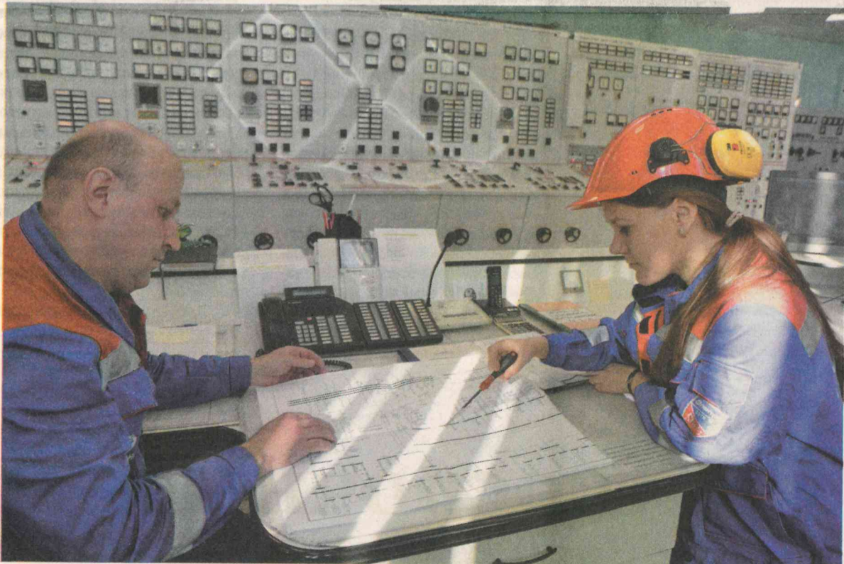
Электромонтёры на ТЭЦ чаще остальных работают в сотрудничестве с коллегами других специальностей