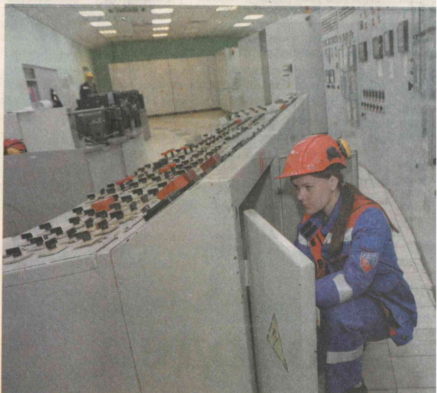
От электромонтёров РЗА зависит работа всей станции